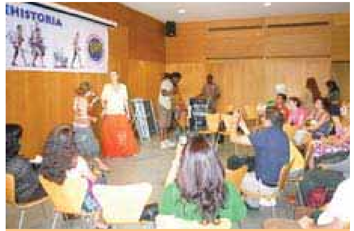
Centre culturel Casino de la Reine de Madrid