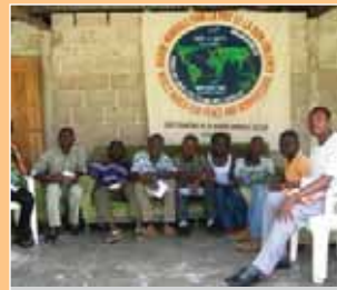
Les promoteurs de Côte d'Ivoire

La MM démarrera simultanément le 2 octobre avec des événements dans ces 5 villes. Puis