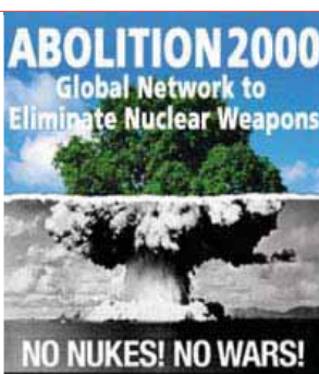
Abolition 2000 INTERNATIONAL NONVIOLENCE

Emergency apporte un soutien aux victimes civiles des conflits armés. Emergency se sent faire partie d'un chemin qui traverse les « lieux où vivent les êtres humains. Penser et définir ainsi la Terre, sans se référer aux frontières et bannières, c'est parler de l'implication de tous dans le destin de chacun. La paix n'est pas un intervalle entre deux guerres. La paix est la politique de l'amitié ».