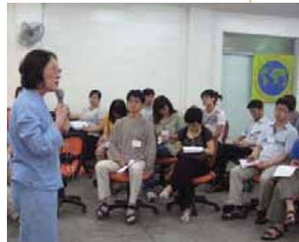
Atelier à l'Université Théologique Méthodiste de Séoul

L'équipe promotrice coréenne de la MM est constituée de plus de trente ONG pour la paix et planifie d'importants événements pour la paix et la non-violence.