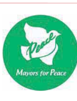
Maires pour la Paix INTERNATIONAL NONVIOLENCE

Réseau international qui travaille pour l'obtention d'un traité d'élimination progressive des armes nucléaires dans un cadre déterminé. Ce réseau est ouvert à tous les organismes approuvant le rapport d'abolition 2000. Il vise à réunir des groupes concernés par les issues pour sortir du nucléaire à travers un forum d'échange d'informations et le développement d'initiatives communes.