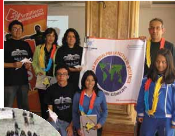
Membres du Club Origami « Quito de papier ».

Pendant cet événement, des centaines de mains se sont jointes pour la seconde année consécutive en Equateur et ont organisé le "Quito de papier", du club d'origami. Les élèves des écoles et institutions de Quito plient des grues et découvrent le merveilleux monde de l'origami.